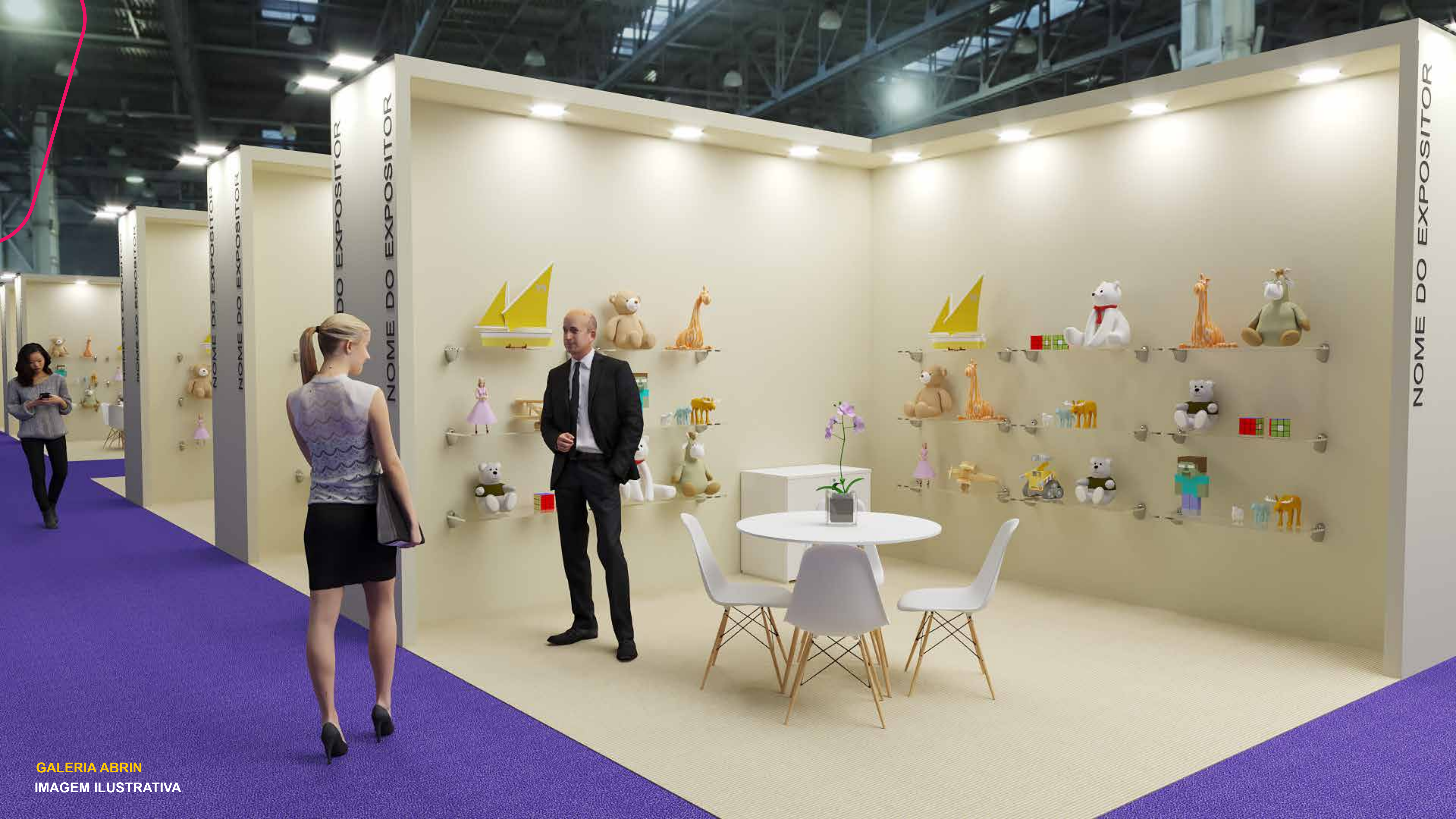
GALERIA ABRIN IMAGEM ILUSTRATIVA