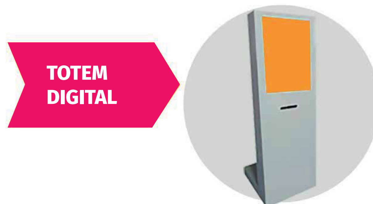
Imagem em modo randômico.

Arte inserida na home do site link para site da empresa.